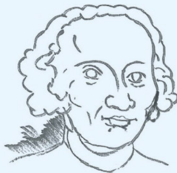
圖一：帕海貝爾 (Johann Pachelbel)

我書中有一圖例 Figure 1.15，說明歌曲如何由簡譜轉換成手機能執行的 STL。最早用台灣啤酒廣告歌，歌詞是：「有緣沒緣，大家來作伙，燒酒喝一杯，乎乾啦，乎乾啦。」在寫書時，我本想換掉這首有中文歌詞的旋律。主要是 Wiely 一開始就要求我寫書一定要全用英文，若